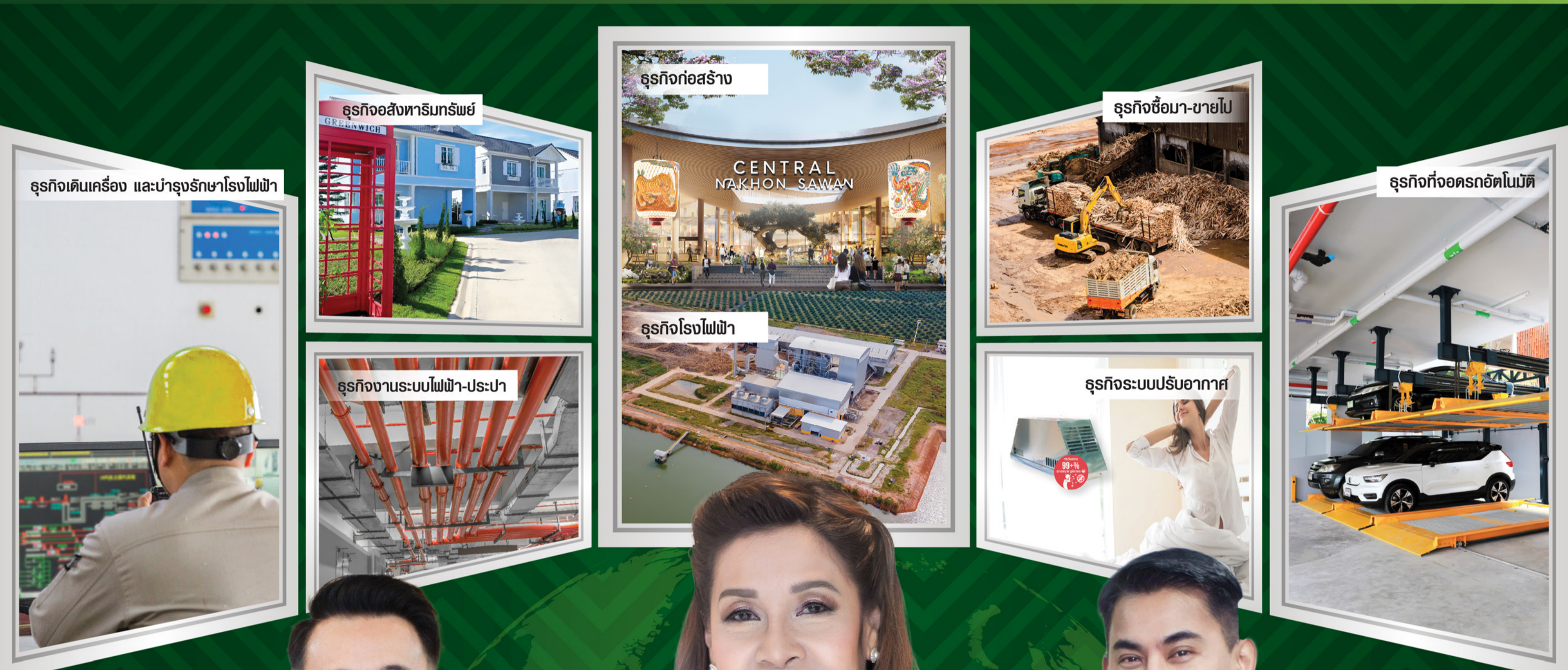
ธุรกิจเดินเครื่อง และบำรุงรักษาโรงไฟฟ้า