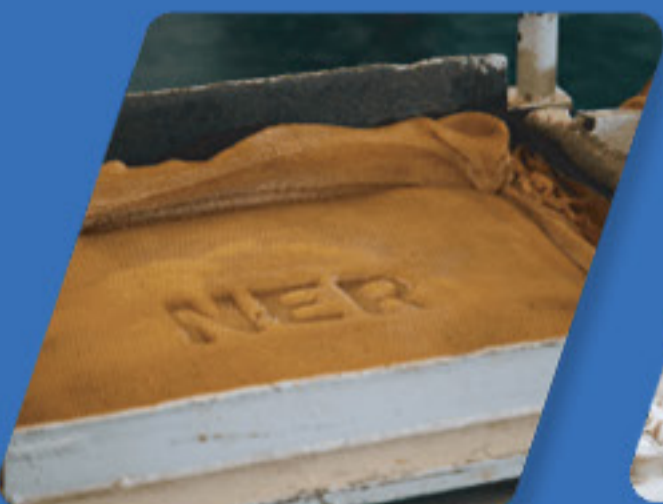
ยางแผ่นรมควัน